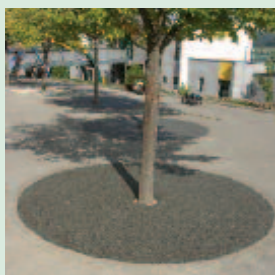
Koreňový systém stromov nebude znepriepustnený.

Ako certifikovaná odborná TerraWay®-prevádzka najprv preveríme skutočný stav miesta, analyzujeme pomery pôdy a nadimenzujeme vrstvu štrku na ktorú bude TerraWay®-povrch nanášať. TerraWay®-zmes je potom priamo na mieste namiešaná v špeciálnej miešačke rozťahnutá na plochu a uhladená. Už po krátkom čase tvrdnutia je možné po povrchu chodiť a podľa vyhotovenia aj jazdiť.